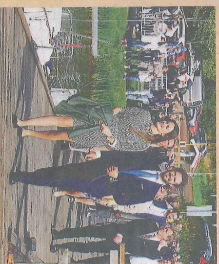
Den 21 oktober kommer prinsparet till Värmland.